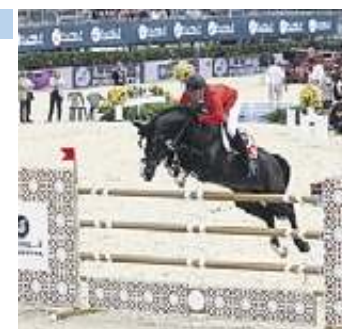
Barcelona repetirá como final de la Copa Mundial de saltos

HÍPICA Barcelona acogerá el próximo 2014 la final de la Fursiyya FEI Nations Cup según confirmó la Federación Ecuestre Internacional (FEI) en Asamblea General, que tiene lugar en Montreux (Suiza) hasta el jueves, gracias al éxito de participación y resultados que tuvo este pasado mes de septiembre.