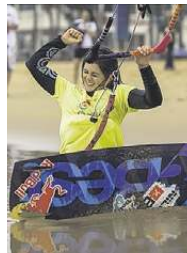
Un nuevo éxito de la catalana

“Me siento super feliz, justo cuando terminó la maga y dijeron que no teníamos que hacer la tercera final no me lo creía. Ya sé que son 9 títulos los que tengo, pero cuando son tan difíciles de conseguir tienen mucho valor y lo que sientes cuando lo consigues es indescriptible”, comentó Pulido en declaraciones facilitadas por Red Bull. La ‘rider’ afincada en Tarifa reconoció que la eliminatoria doble había sido “bastante complica-